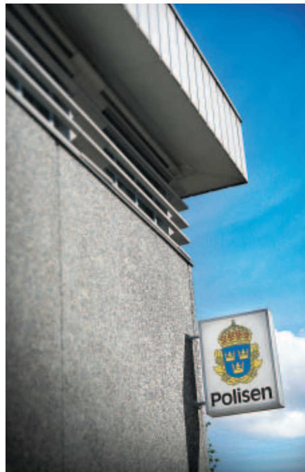
...men mest troligt är att han sitter på häktet vid polishuset på Stockholmsvägen. Här sitter normalt anhållna som kräver högre säkerhetsklass.